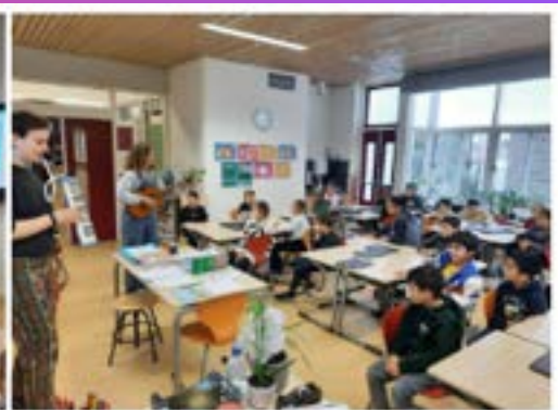
Repetitie liedjes voor Super Sint Maarten met 'De Pretvormers'