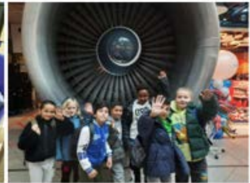
Taaltrip naar Schiphol