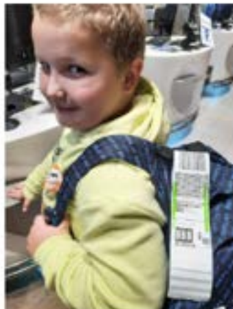
Klaar voor vertrek naar New York!