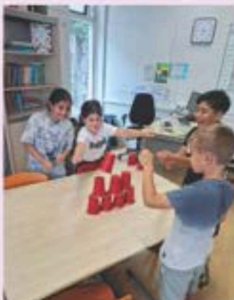
Alaa en Roujin

De eerste dag gingen we elkaar leren, kennen en spelletjes spelen zo als stilte bal. tweede dag ging we gymen. De eerste dag kregen we nog rond leiding door de school .En op woensdag kregen we muziekles en op woensdag hebben we tosti dag. En we gaan binnen kort gaan wij al schoolreisje naar duinerel en we hebben er zin in!